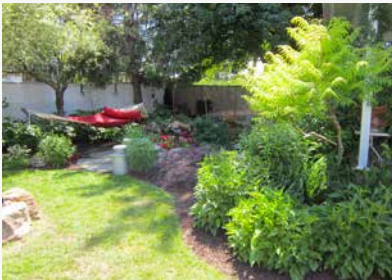
1 er prix et vote du public