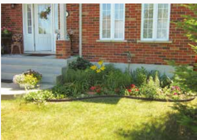
3 e prix