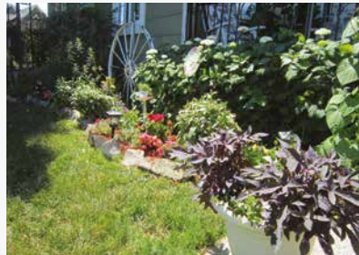
2 e prix