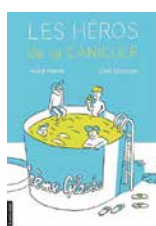
Les héros de la canicule de André Marois