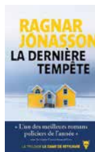
La dernière tempête de Ragnar Jonasson