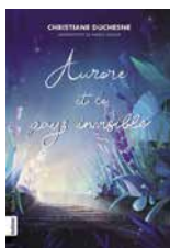
Aurore et le pays invisible de Christiane Duchesne