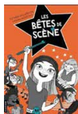
Les bêtes de scène de Esther Villardón