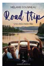
Road trip – Une virée mère-fille de Mélanie Cousineau