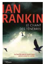
Le chant des ténèbres de Ian Rankin