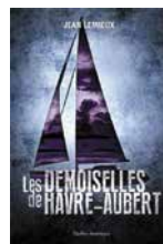
Les demoiselles de Haure-Aubert de Jean Lemieux