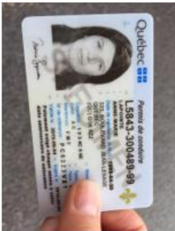
Copie de votre permis de conduire