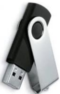
Clé USB contenant tous ces documents