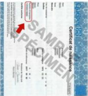
Copie de votre certificat de naissance