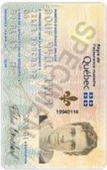
Copie de votre carte d'assurance maladie