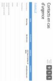
Votre carnet d'adresse