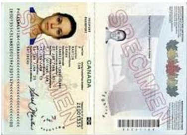
Copie de votre passeport