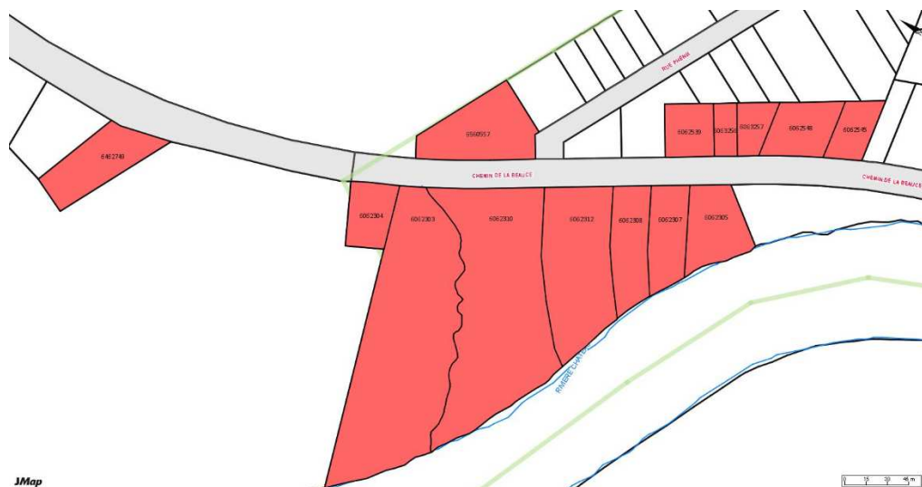
Bassin de taxation – Service d'aqueduc